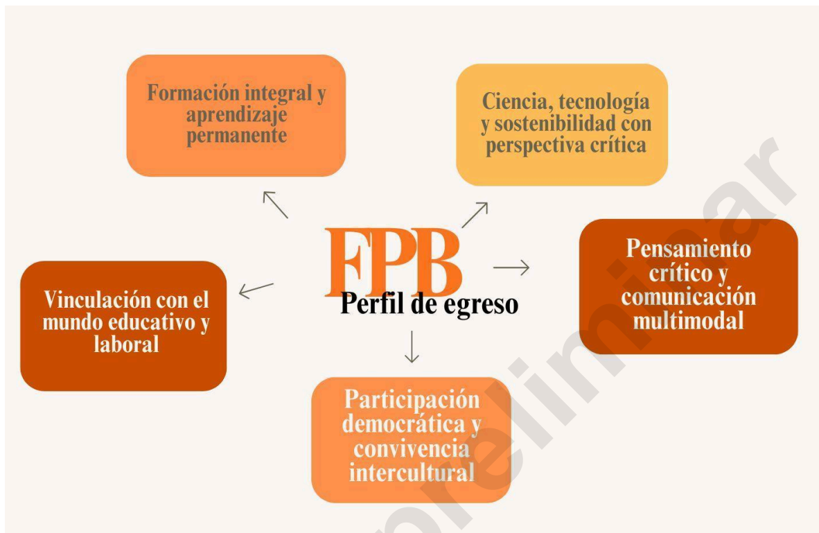
Imagen N° 1: Perfil de egreso de la propuesta de Formación Básica Profesional

autónomos y comprometidos. A continuación se presenta la Imagen N° 1 como síntesis de lo antes expuesto.