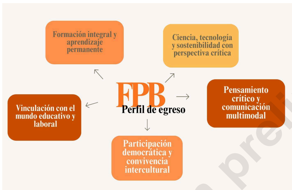
Imagen Nº 1: Perfil de egreso de la propuesta de Formación Básica Profesional